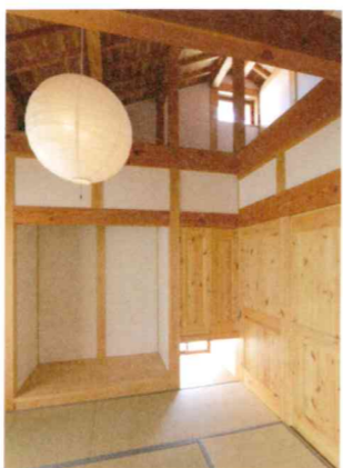
しっとり心も和む和室。仏壇を置くスペースや収納もしっかり確保