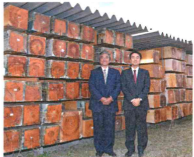
自然乾燥させて合格した材料のみ使用

大喜工務店は玄人（くろうと）好みする工務店だと、よく言われます。また、勉強熱心な方が最後に辿り着く会社でもありません。大手ハウスメーカーと、堂々と内容で比較した上で決められる方が多いです。 圧倒的な違いを歴然と確認。キーワードは「比較すること」です。ね。「そんなすーいー家がそんな価格で出来るはずがない。」と半信半疑のお客様のお父様。 大量の木材の自然乾燥倉庫と工事中の現場を見て、一瞬にして