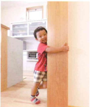
H邸と同じく建物をどっしり支える8寸の大黒柱。「ほくもお気に入り!」