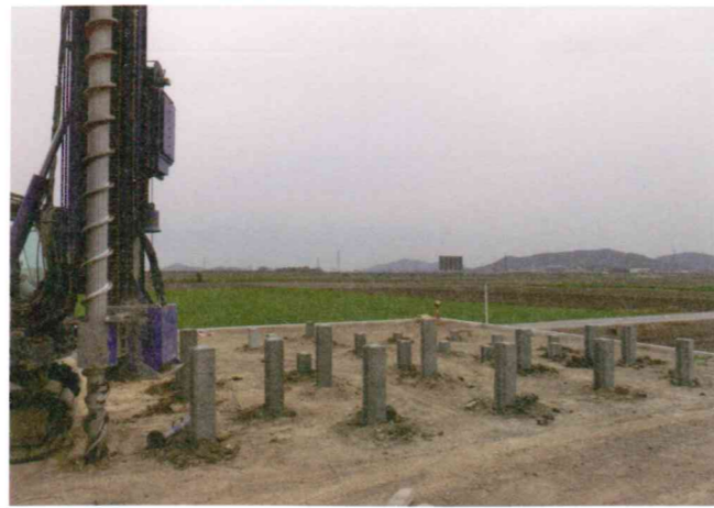
軟弱な地盤にはPCパイルによる地盤改良を施し、全てのくいを確実に支持層まで到達していることを施主と確認