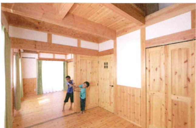
太い梁が印象的な2階子供部屋。クローゼットの扉も無垢のバイン材で造作。入口は2つあるので、将来は仕切って使うことも