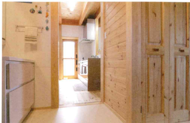
洗濯機のある脱衣所から勝手口へ一直線。整理棚の高さや収納の大きさなどは、奥さんが大工と相談して決定したので使い勝手は抜群