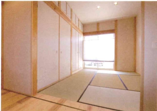
珪藻土の真壁づくりの落ち着いた和室。普段は家族のくつろぎの空間として、親戚や友人の宿泊場所としても活躍。収納スペースもしっかり