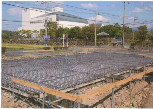
鉄筋の量に驚き！平屋建てでも3階建て基準のベタ基礎を標準仕様