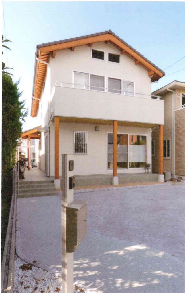
手入れしやすいタイルデッキを設けた小粋な1邸。子どもの飛び出し防止や採光性も考え玄関は横面に。建物の前後は駐車場や子どもの遊び場として活用