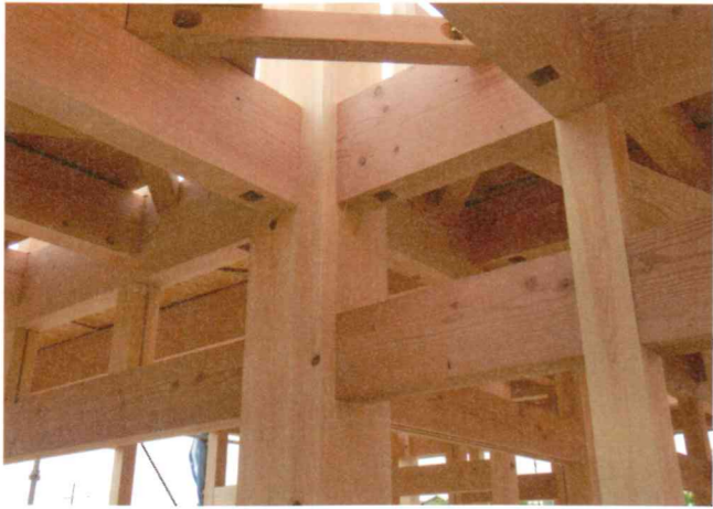
しっかりと組み上げられたヒノキ柱や梁(はり)。1本1本が強い木を使い、構造体も強くなる組み方により、圧倒的に強い構造体に