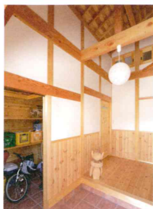
窓で温度調節ができる吹き抜けの玄関。土間収納は自転車も入る大容量