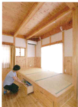
食事後くつろいだり、洗濯物を取り込める畳コーナー。収納部分もたっぷり