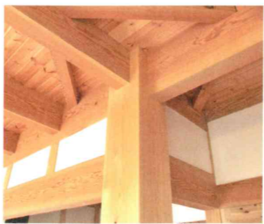
8寸角以上の東濃檜の大黒柱を使用