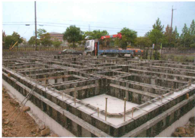
コンクリート強度や厚さ、立ち上がり部分の多さにも驚き