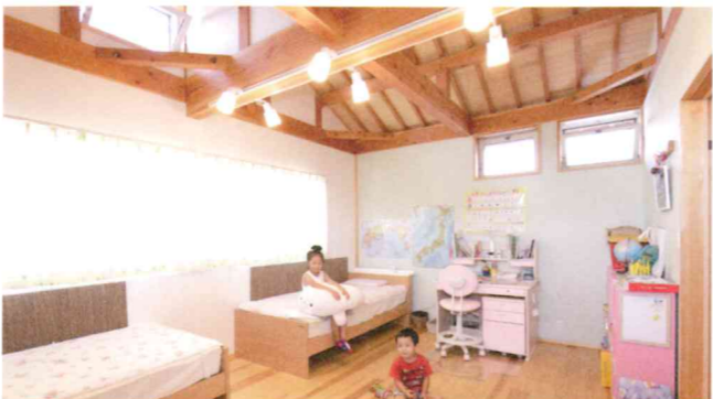
天井が高く明るい子ども部屋。今は姉弟一緒に仲良く、大きくなったら一人部屋に仕切って使える。通気用の開口部は全部屋に標準仕様