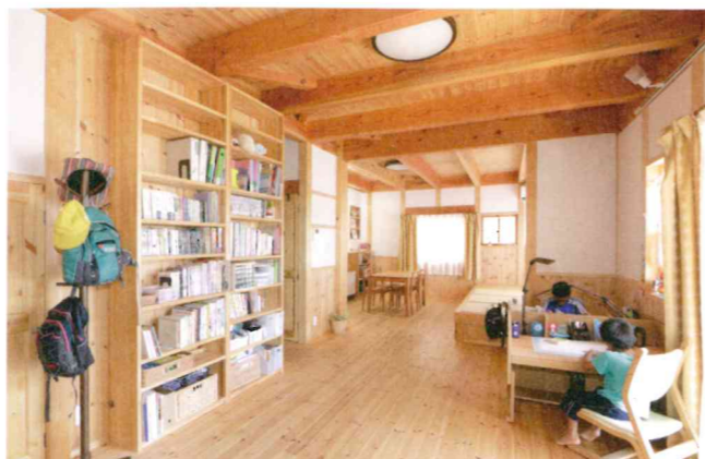
開放的なLDK。子どもたちの姿を見守りたいという奥さんの希望で勉強机や本棚もリビングに。最小限の暖房で大空間でもしっかりと暖かい