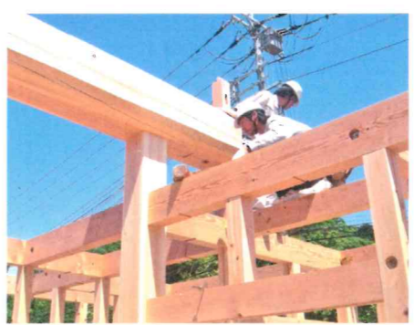
太い柱と梁を組み込んでいきます

完成保証に加えて、契約金までもが、その都度の後払いでよいのです。 過払いの時期は一瞬たりともありません。 一般的にはプランが決まれば契約をし、契約金を前払いするわけです。 当社は、設計図を作成し建築確認申請をし、住宅あんしん保証などの手続きも済ませ、ほとん