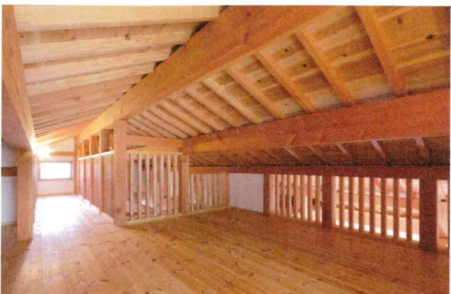
季節のものをたっぷりしまえる3階部分のロフト。しっかりした階段なので上り下りもラクラク。今は子どもたちの遊び部屋として活躍