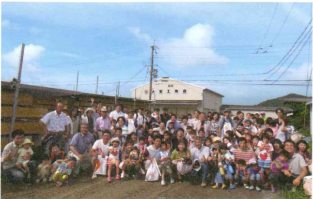
同社で建設中、建築予定の家族。設備メーカー主催のイベントには約160人が参加