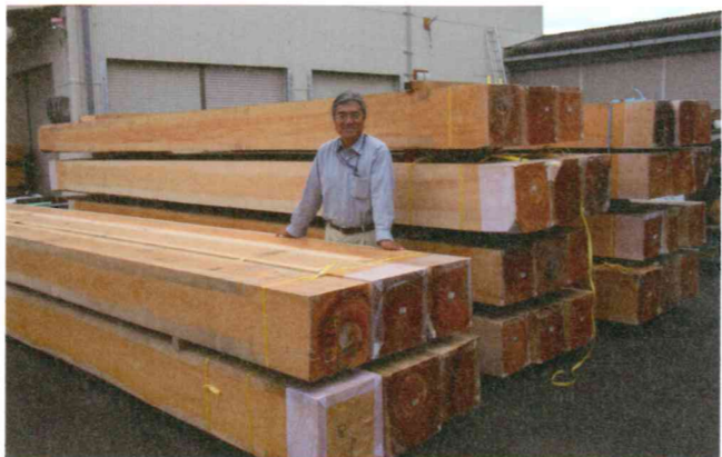
岐阜県や長野県産の良質のヒノキを大量に仕入れ、自社倉庫で長期自然乾燥。強さとともに揺れを受け止めるしなりも生まれる