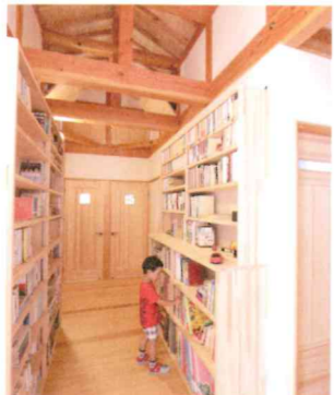
2階廊下の両側に天井までの本棚を設置。読書が趣味という1さんが希望