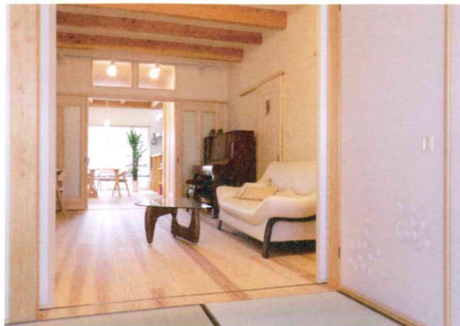
細長い敷地に沿って和室、リビング、ダイニングキッチンを配置。来客のときなど使い方により空間を仕切ることも可能