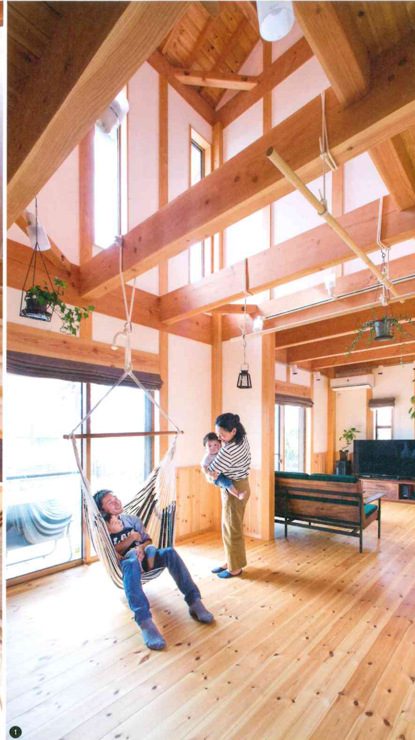
①小屋裏まで7mほど天井高がある吹き抜け空間。耐震性能は建築基準法の1.7倍を満たしている。高窓からは月も見え、「子どもはうさぎさんがお餅つきをしてくる、などと話します」 ②・③「人工乾燥の材料ではなく、自然乾燥された大黒柱を、リビングの目立つところに入れたい」という夫妻の要望で、30cm角の太く立派な東濃産の大黒柱を用いている